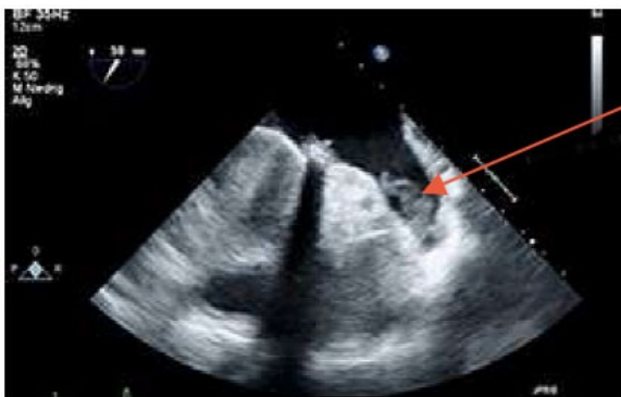
Blodprop i venstre forkammers hjerteøre (aurikel)

Personer med atrieflimren (forkammerflimren) har øget risiko for at få blodpropper i hjernen. 25% af alle blodpropper i hjernen skyldes blodpropper, der dannes i hjertet under atrieflimren, men som river sig løs og føres med blodbanen til hjernen. Langt de fleste blodpropper dannes i en lille "blindtarm" til det venstre forkammer - hjerteøret eller auriklet.