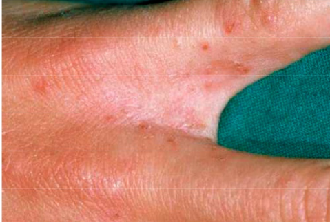
Fnat mellem fingre